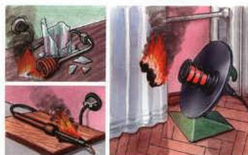
Оставление без присмотра электрических нагревательных приборов

Причиной возгорания может стать попадание молнии при неправильно выполненном заземлении или полном его отсутствии. Нельзя исключать и умышленных вредительских действий со стороны отдельных граждан.