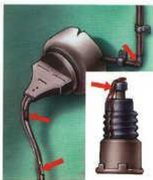
Неисправности электропроводки Пользование самодельными предохранителями